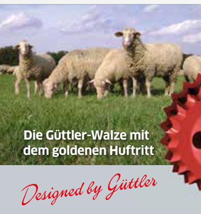
Die Güttler-Walze mit dem goldenen Huftritt